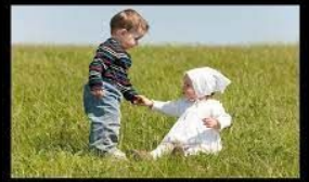
使人和睦的人有福了，因为他们必称为神的儿子。